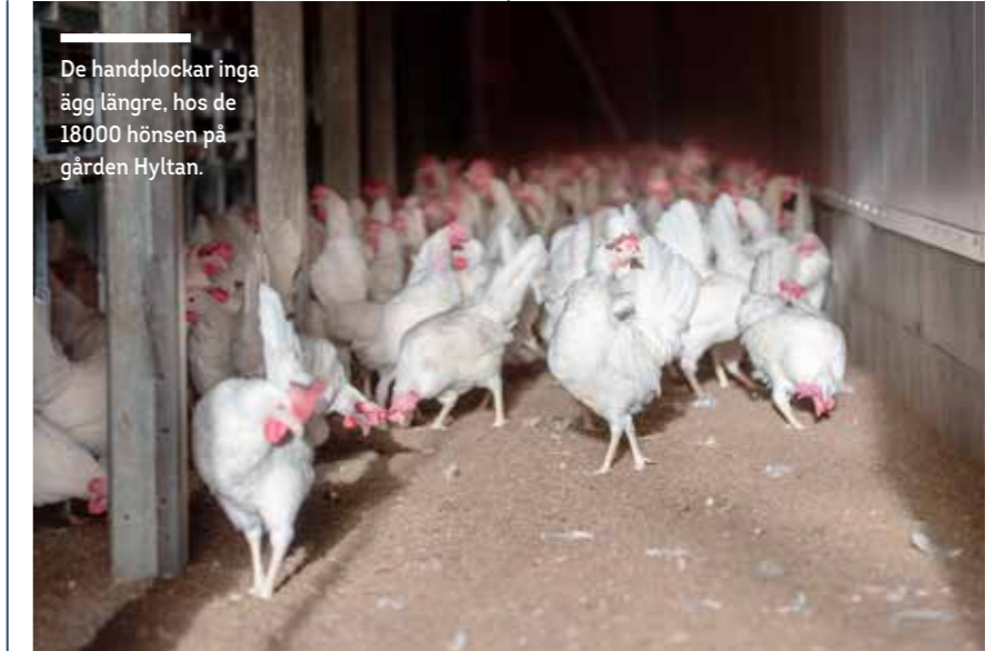
De handplockar inga ägg längre, hos de 18000 hönsen på gården Hyltan.

Carl, 39, äldst av brorsorna, får föra talan i intervjuer som dessa. Det har varit en del uppmärksamhet kring dem redan.