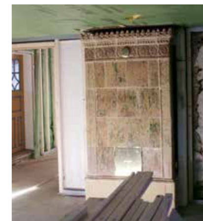
Kakelugnen, ursprungligen från det gamla tegelbruket i Adelöv, har omsorgsfullt restaurerats med nya mässingdetaljer.