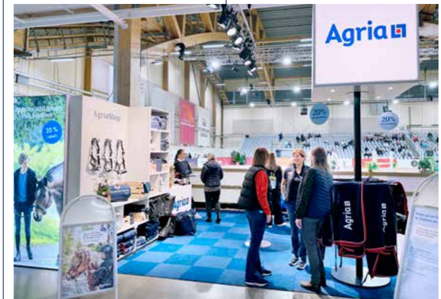
Agria erbjuder råd och hjälp dygnet runt via sin sjukvårdscoordinator på telefon 0775-88 88 88.

ty, Nicke och Cristallino - och i tävlingslivet spelar försäkringen en viktig roll.