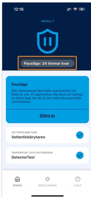
Stäng av pausläge

Vill du komma i kontakt med oss är du varmt välkommen att mejla till vattenvakten.stockholm@lansforsakringar.se